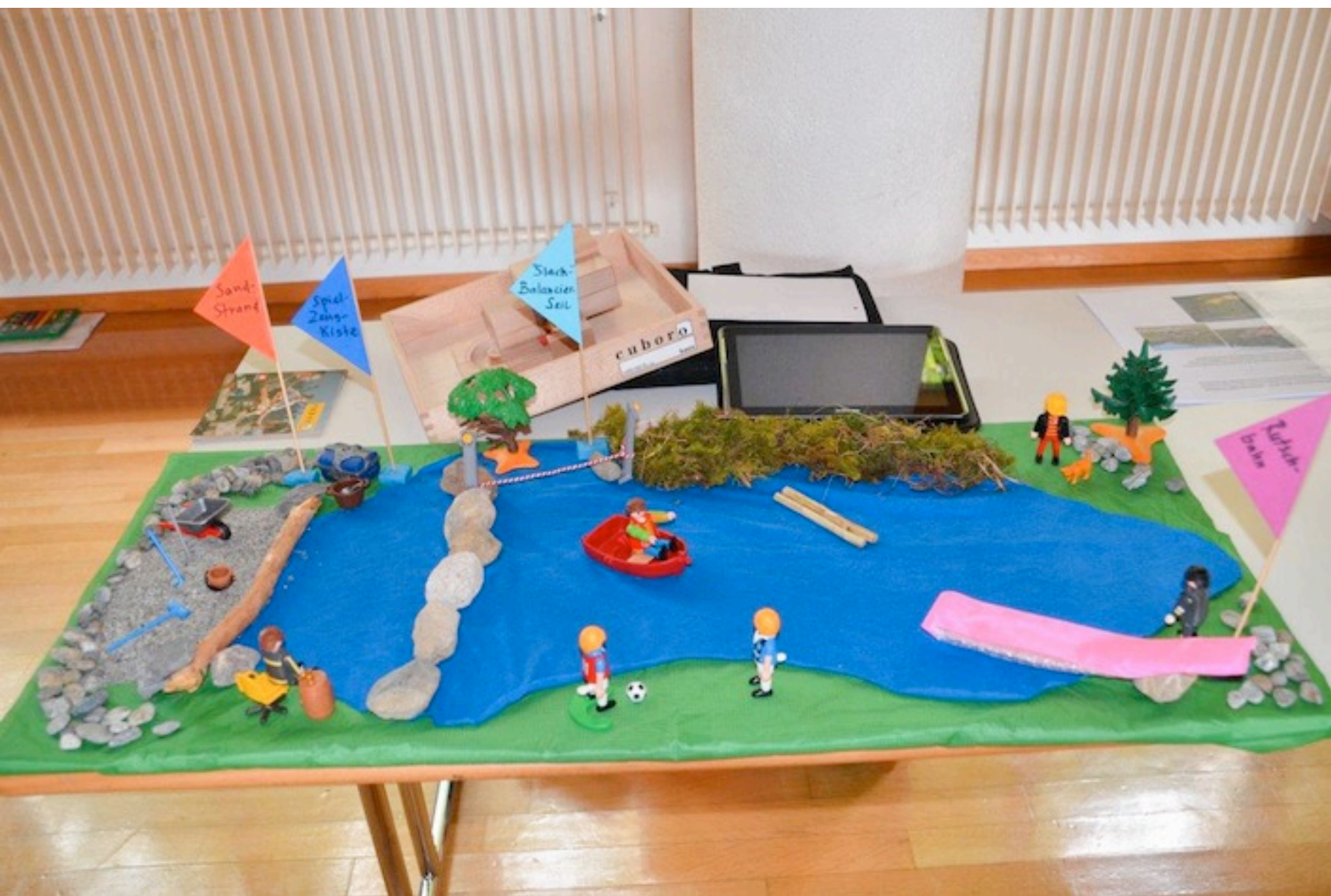
Der Badesee im Modell. Her wurden die gewünschten Ergänzungen eingebracht.